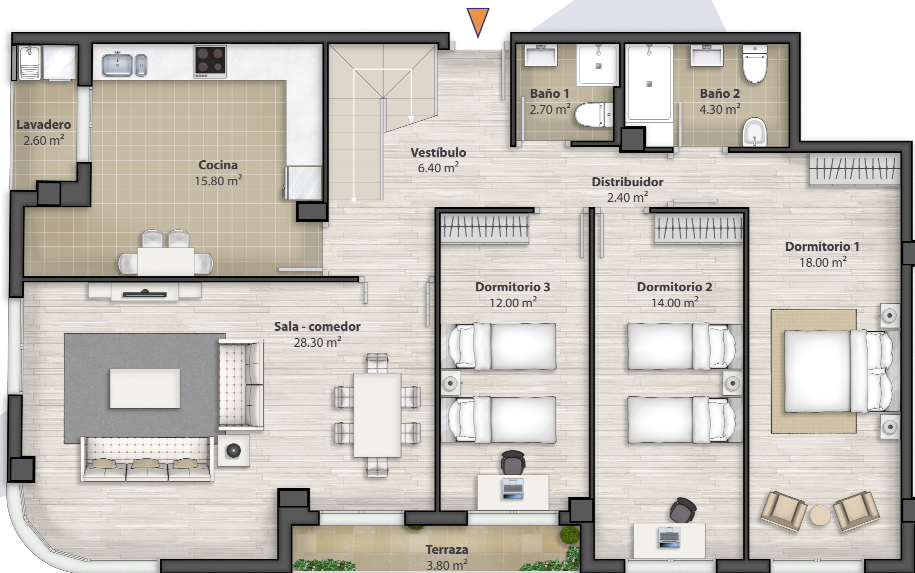
Planta tercera Vivienda tipo B