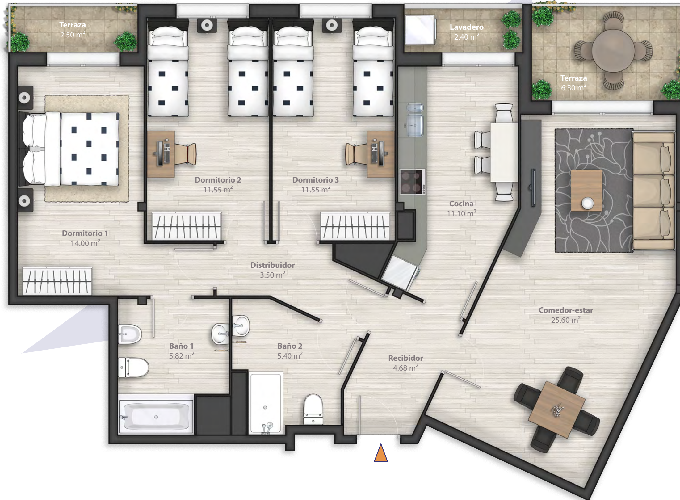
Planta 1 a Vivienda tipo B