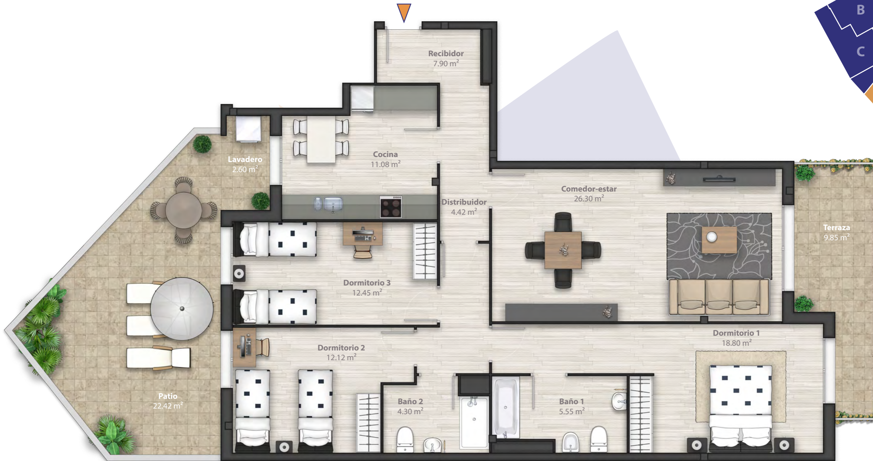
Planta 1ª Vivienda tipo D