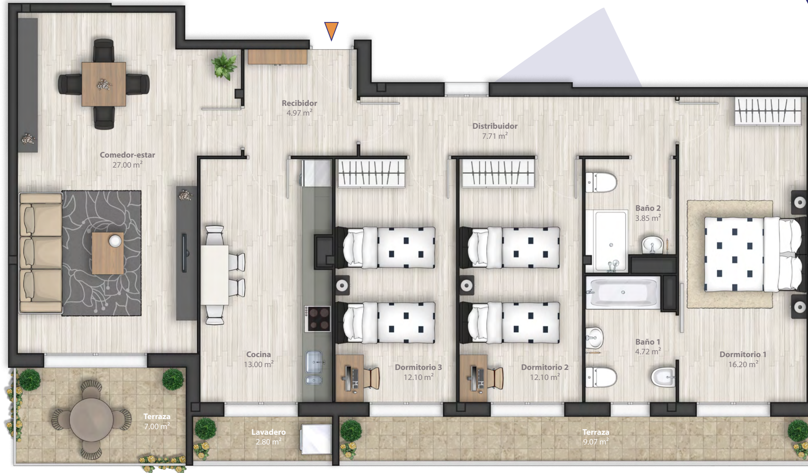
Planta 1ª Vivienda tipo E