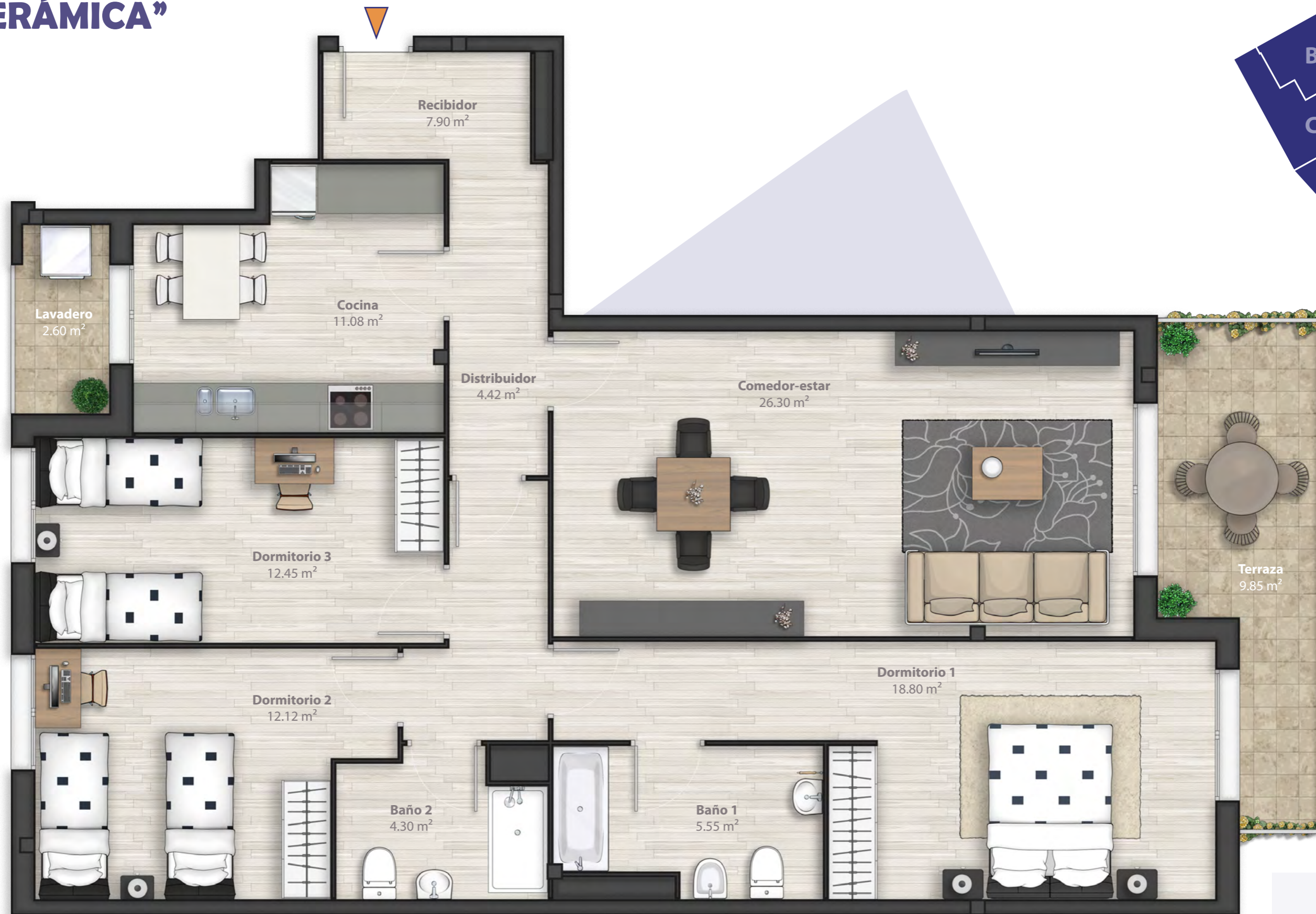
Planta 2ª y 3ª Vivienda tipo D